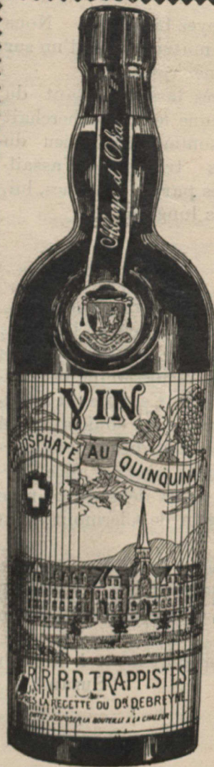
Exigez bien cette étiquette lorsque vous achetez. C'est le seul véritable.