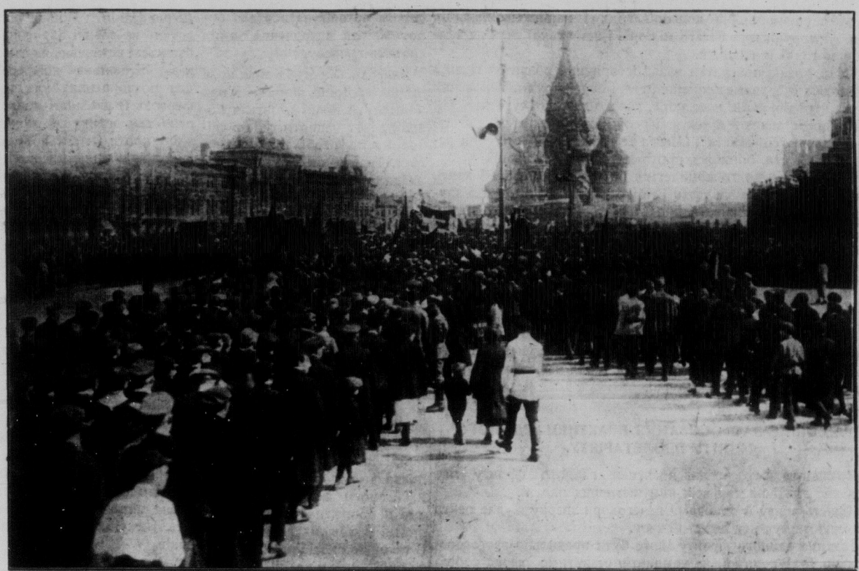
Велика робітничка маніфестація на Червоній Площі в Москві в день 1. Травня.