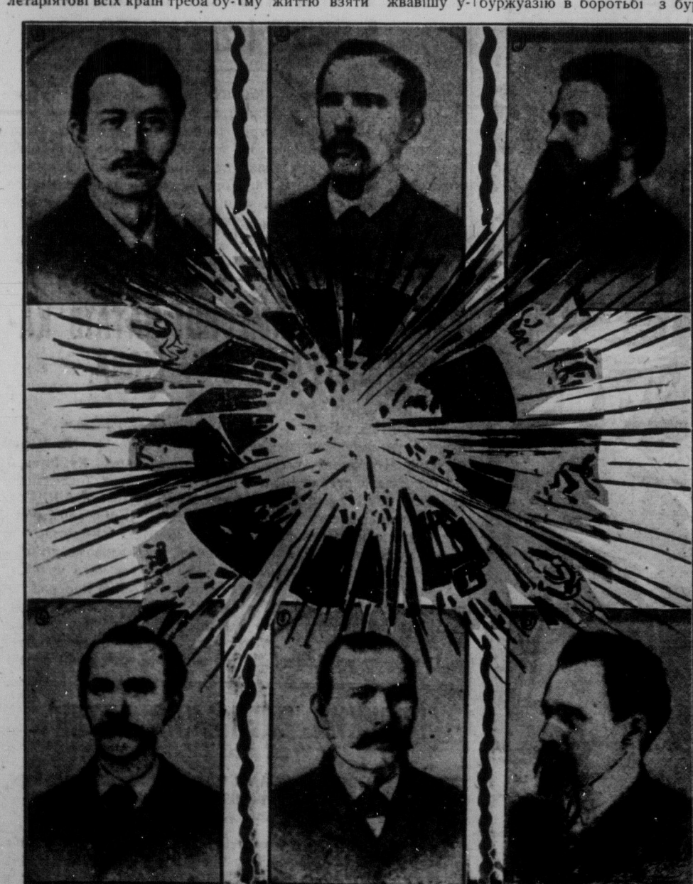
БОМБА, З ЯКОЇ ВИБУХНУЛО ПРОЛЕТАРСЬКЕ СВЯТО ПЕРШОГО ТРАВНЯ.

Соціал-демократичні провадирі зрадили робітничтво замість голосити братання всіх народностей, послали робітничтво на війну. Зрада їх однак скоро діждалася відплати. В 1917 році вибухла російська революція, котра пробудила робітничтво до нового бою. Від зрадничької соціал-демократії велика більшість працюючих відвернулася й заложила нову революційну партію, партію комуністичну. Під прапором комуністичної партії і Комуністичного Інтернаціоналу вернено травневим демонстраціям їх давнє значіння. Травневі маніфестації є висловом незломної рішучості боротися проти буржуазії аж до повної побіди працюючих.