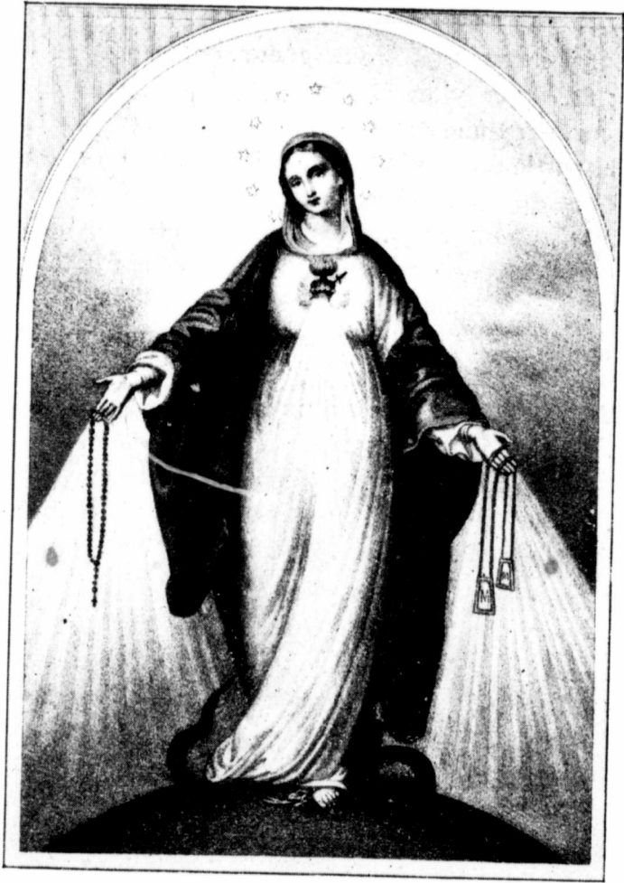
Le Chapelet et le Scapulaire, voilà les deux principales livrées de l'âme dévote à Marie.