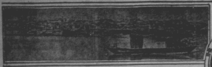
GENERAL VIEW OF BELGRADE