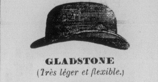
GLADSTONE (Très léger et flexible.)