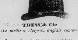
TRESS & Co (Le meilleur chapeau anglais connu)