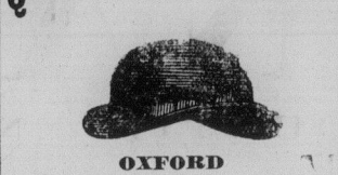
OXFORD (Un joli chapeau pour jeune homme)