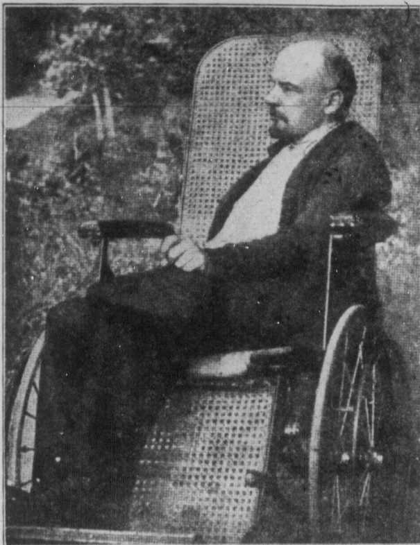
Н. ЛЕНІН підчас своєї недуги в інвалідному кріслі.