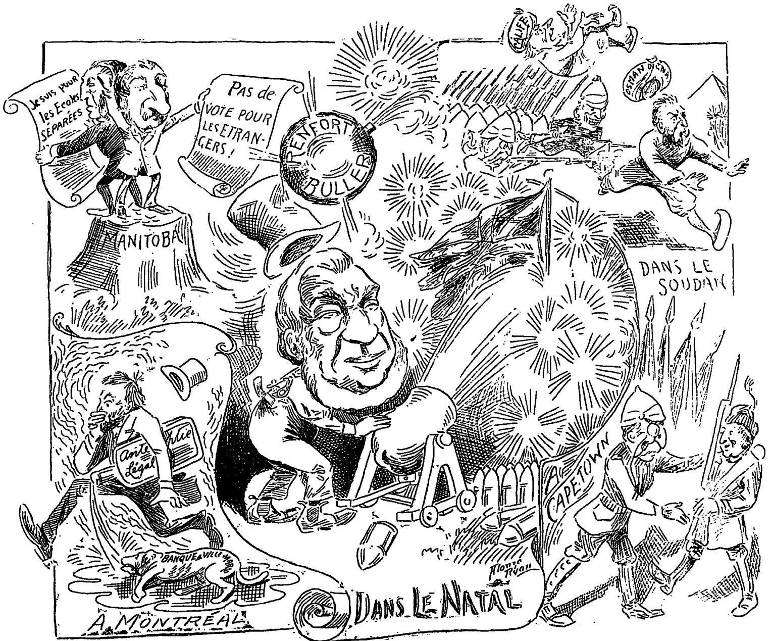
LES EVENEMENTS DE LA SEMAINE