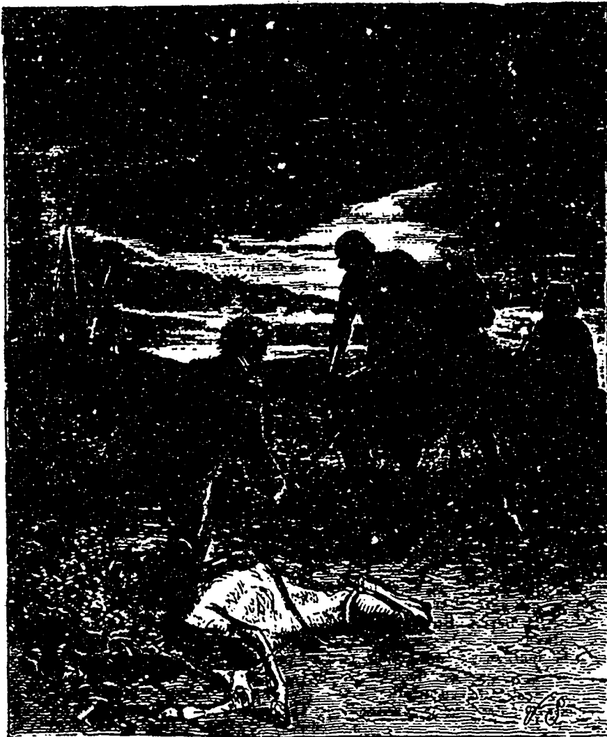
Place, ou tu es mort ! menaçait le cavalier accusé de vol. (Page 495).

—Attendez-moi ! exclama le vieillard en courant aussi vite que la gêne de ses liens le lui permettait ; vous ne trouverez pas l'entrée. Il y a une cachette.