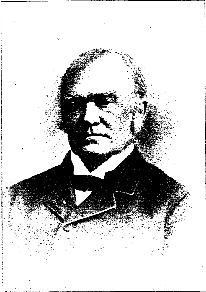
SIR J. J. C. ABBOTT