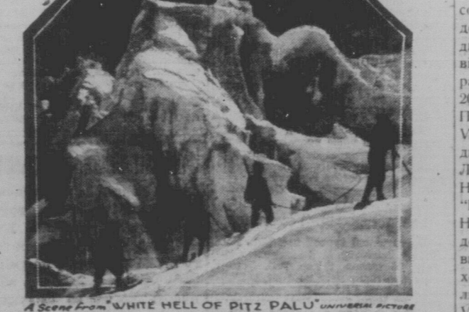
А Scene from "WHITE HELL OF PITZ PALU" UNIVERSUM ACTORS. Дуже захоплююча німецька фільма, яка буде висвітлюватися в суботу, 23 травня в Укр. Роб. Домі у Вінніпегу від 7-ої й 9-ої год. вечером. Приходьте громадно! Тикети для дорослих 25 центів, а для дітей 10 центів.