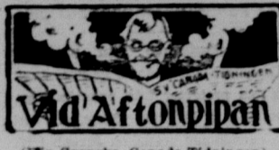
ETT VISBT SKILJETECKENS BETYDELSE.