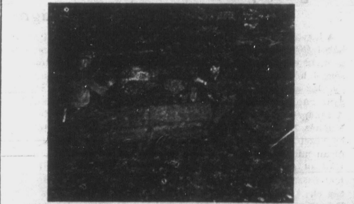
"Ladolnak" azaz felelnek a magyar bányászok a drumhelleri bányák egyik köszénfejítő tárnájában. Amint képünkön is látható, a legkisebb beomlás is könnyen veszélyeztetheti honfitársaink egészségét, sőt életét is a megélhetésért a föld mellyen folytatott küzdelemben.