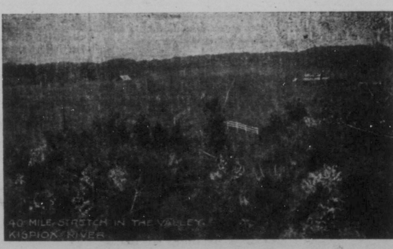
EN FYRATIO MIL LÅNG STRÄCKA I DALEN.

kan det köpas för $10.00 pr. acern, en tredjedel kontant, resterande i tvååra lika årliga afbetalningar med 6 procentas ränta pr. år. TILL EN VERKLIG SETTLARE skola vi ayttira 40, 80 eller 160 acres, alltefter önskan. Vid mottagandet af $2.00 pr. acre som nämdt (för verklig sett-lare) skola vi göra valet för honom förvänta att han själf person-ligen gör undersökningen så snart som möjligt, då han kan ombyta sitt land valdt af oss för hvilket annat stycke som helst som ej re-dan utvalts, om han så önskar. VI INSKRÄNKA DENNA KOLONI ENDAST TILL SKAN-DINAVER och skola särskildt bemöda oss om att gifva dem före-trädet. Vi afgå dit med den första exkursionen Onsdagen den 22 April och sedan omkring hvarannan vecka därefter så länge anmähningar inkomma. Till en hägad spekulant på detta land för $10.00 pr. acre äro vi villige att tillåta en man utvälja för sina vännar vid mottagandet af kontant betalning. Men för en verklig settlare göra vi anspråk på att landet inspekteras af honom själf som han själf kommer att bo på. Det är i sin tillbörliga ordning att han själf gör valet af sitt hem. SOM DETTA ÄR ETT ENASTÄENDE TILLFÄLLE i ert lif, kunna vi ej taga någon öfver detta land, med mindre än kontant nedbetalning gjorts som nämdt. Men alla köpare hafva samma till-fälle att ombyta valet af land efter de kommit dit.