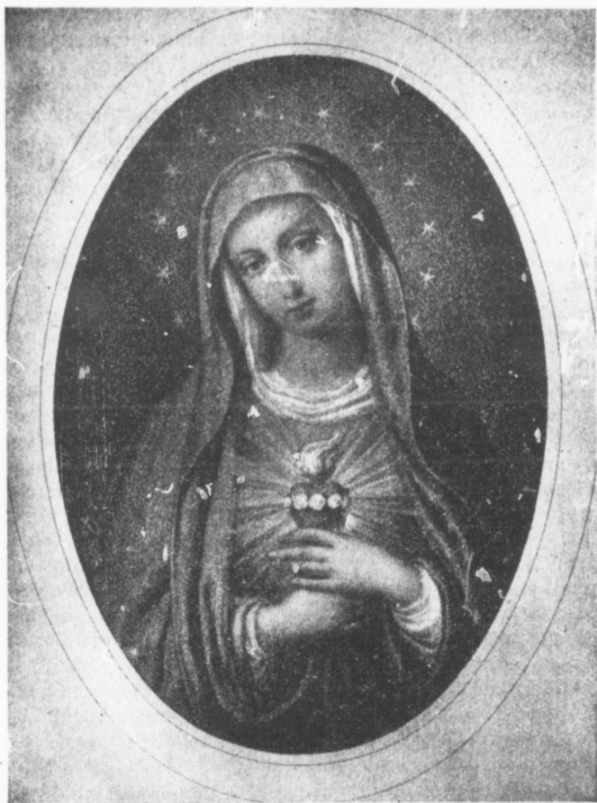
LE SAINT CŒUR DE MARIE

Il célébrait la sainte Messe avec une ferveur sans égale, après s'y être préparé avec grand soin : " Le saint Sacrifice, disait-il, est quelque chose de si grand qu'il faudrait trois éter-