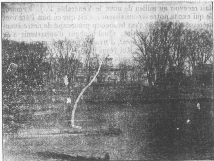
JUVÉNAT ET VUE DE LA RIVIÈRE.

Un brave ami se rend un samedi soir à la rivière des Prairies, et à peine installé y fait une pêche merveilleuse . Il nous apporte un magnifique esturgeon, dont la taille dépasse la nôtre, et qui pèse 56 livres. "Autrefois, dit-il, j'en ai pêché un de 109 livres, gros comme un homme." Allons,