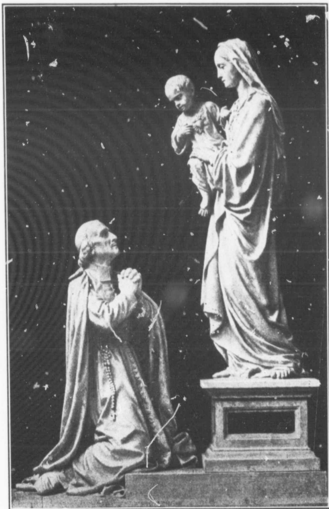
LE BIENHEUREUX JEAN EUDES Premier Apôtre des S. S. Cœurs de Jésus et de Marie.