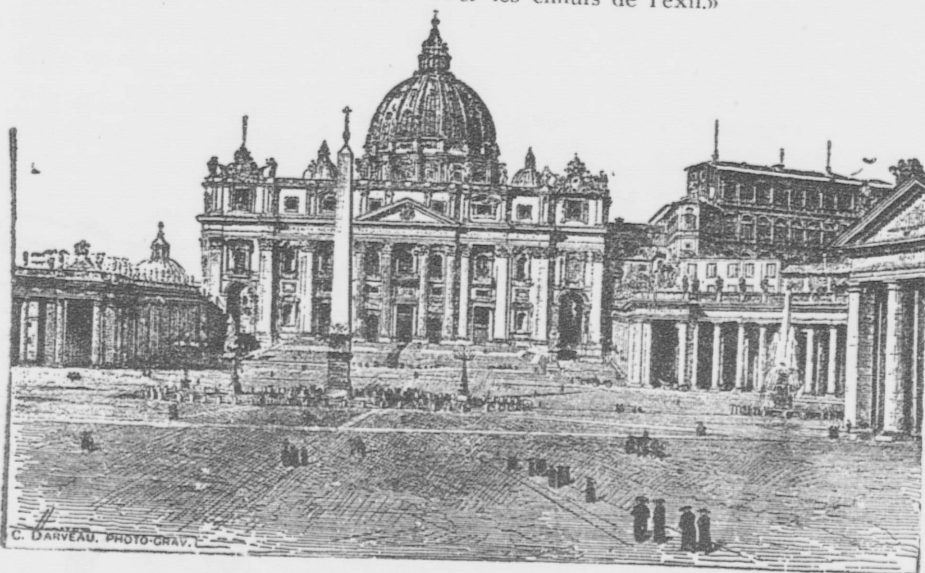
EGLISE SAINT-PIERRE DE ROME

Aux dignes héroïnes de cette démonstration cordiale, nous souhaitons succès et bonheur. Pussions-nous leur faire oublier les ennuis de l'exil.»