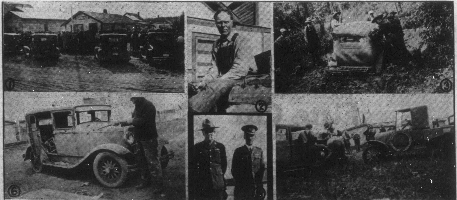
Ralls saskatchewanai csendőrkaplár gyilkosainak üldözéséről közlünk ezúttal néhány mozgalmas fényképet. 1. Az egész vidékről összegyűlnek a farmerek a gaztett színhelyén. 2. Az a skandináv farmer, aki pontos személyleírást adott a menekülő banditákról. 3. Ilyen utakon akarták utolérni a gyanúsítottakat a vöröskabátosok. 4. Motorjavítási jelenet az üldözők főhadiszállásán. 5. A yorktoni csendőrkörlet vezetője és a segítségére sietett prince-alberti őrmester, akik napokon át nem hunyták le álomra szemüket. 6. Az üldözöttek által elhagyott "Plymouth" autómobil, melyet Saskatoonban loptak a végül mégis póruljárt banditák.

Aberdeenben egy mozi a következő táblát akasztotta ki: "Kilencven éven felüliek, ha szülei kisérletében jönnek, ingyen mehetnek a moziba".