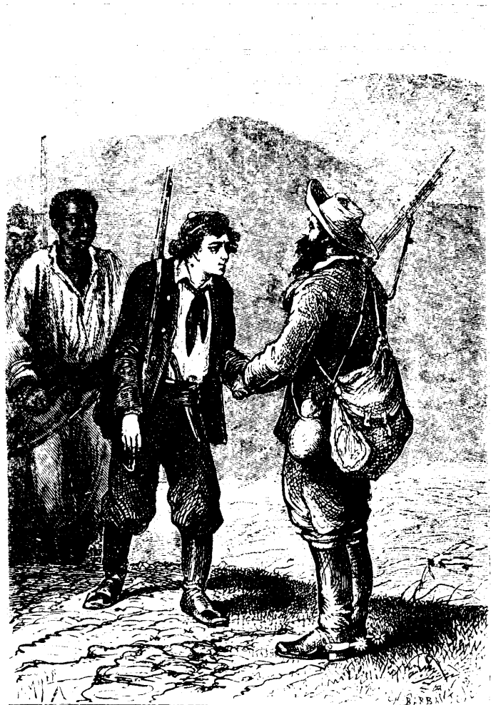
Soyez le bienvenu vous-même.