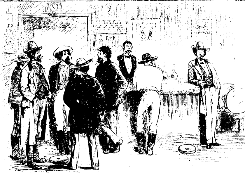
UN RESTAURANT DANS L'OUEST.