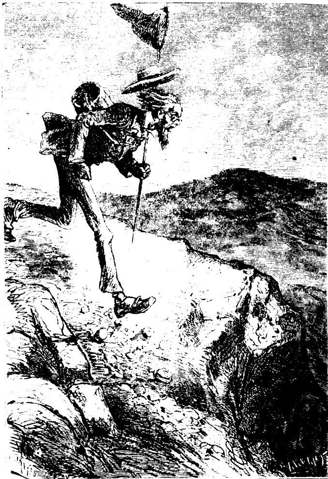
Cousin Bénédicet était littéralement furieux.