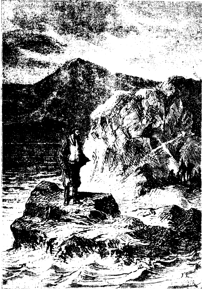
Connaissait-il donc cette entrée ?