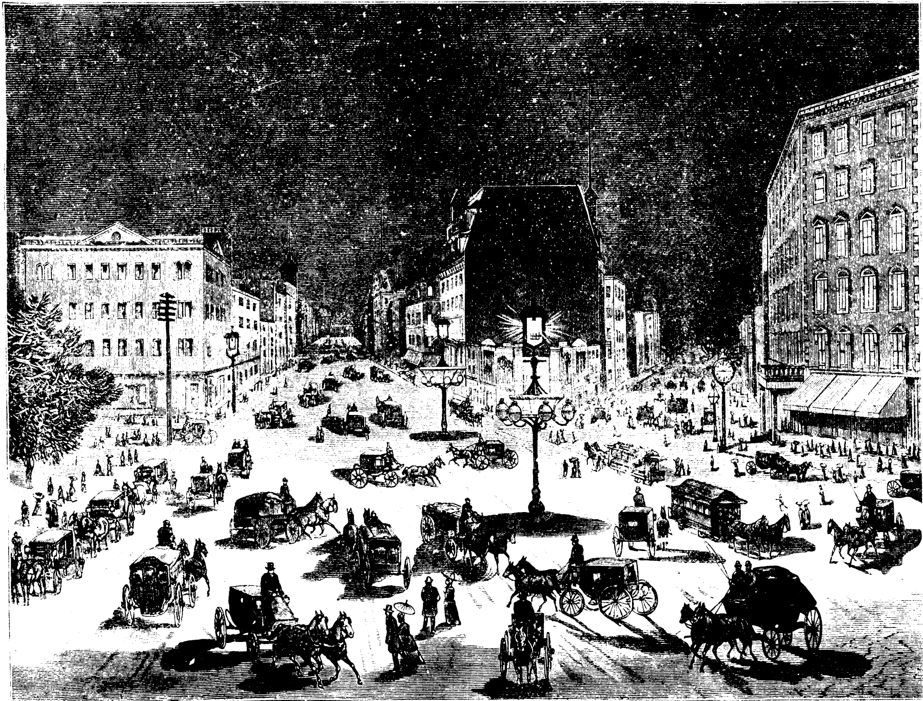
NEW YORK ÉCLAIRÉ PAR LA LUMIÈRE ÉLECTRIQUE.