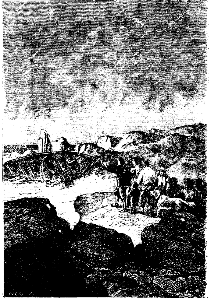
En revoyant leur bâtiment.