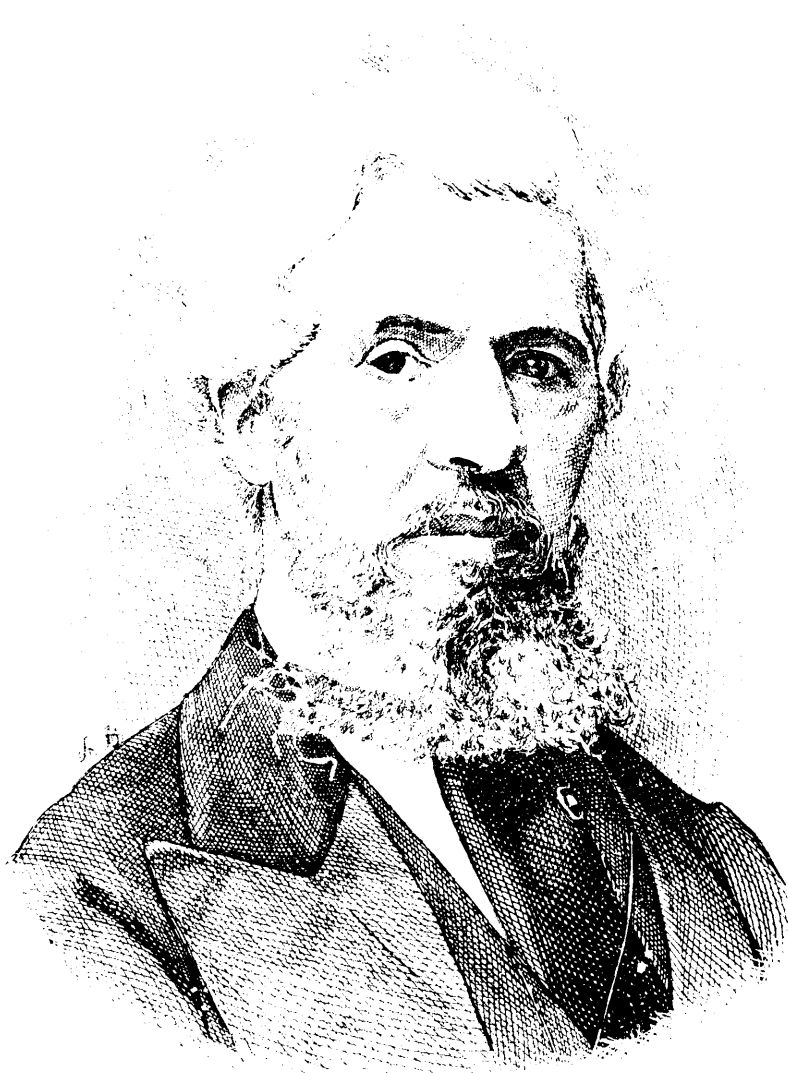
LE JUGE DUNKIN.