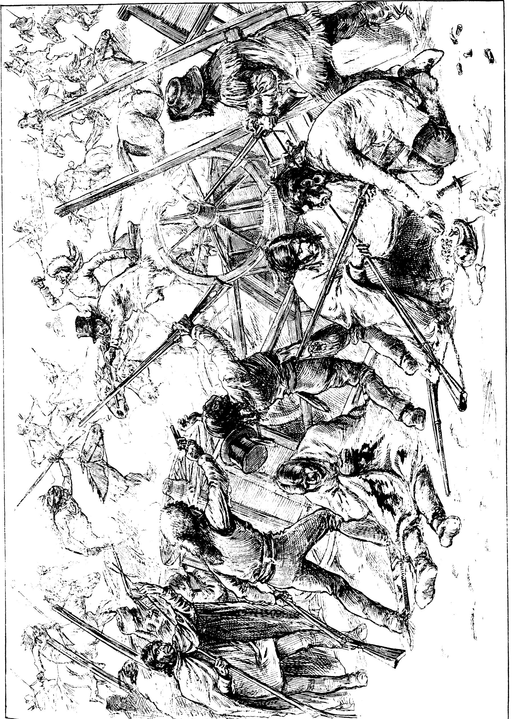
COMBAT SANGLANANT ENTRE LES CREES ET LES SIOUX.