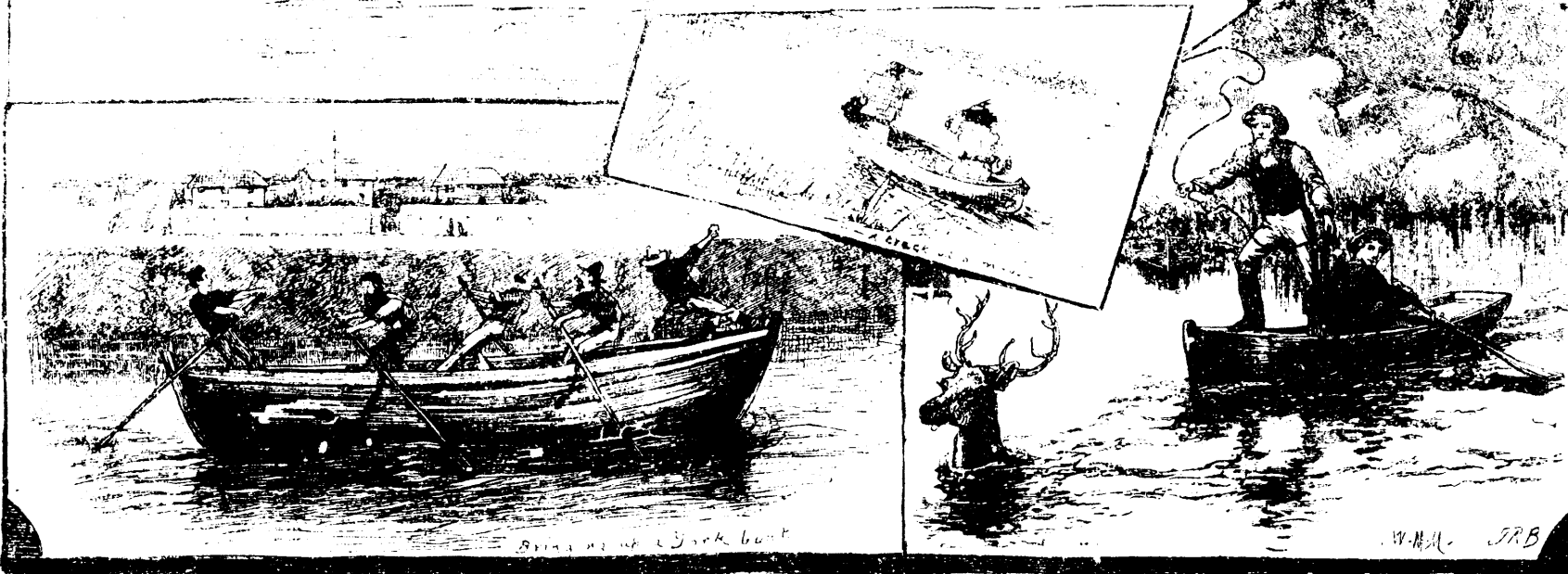
SCÈNES DE LA VIE REELLE A LA COLOMBIE ANGLAISE.