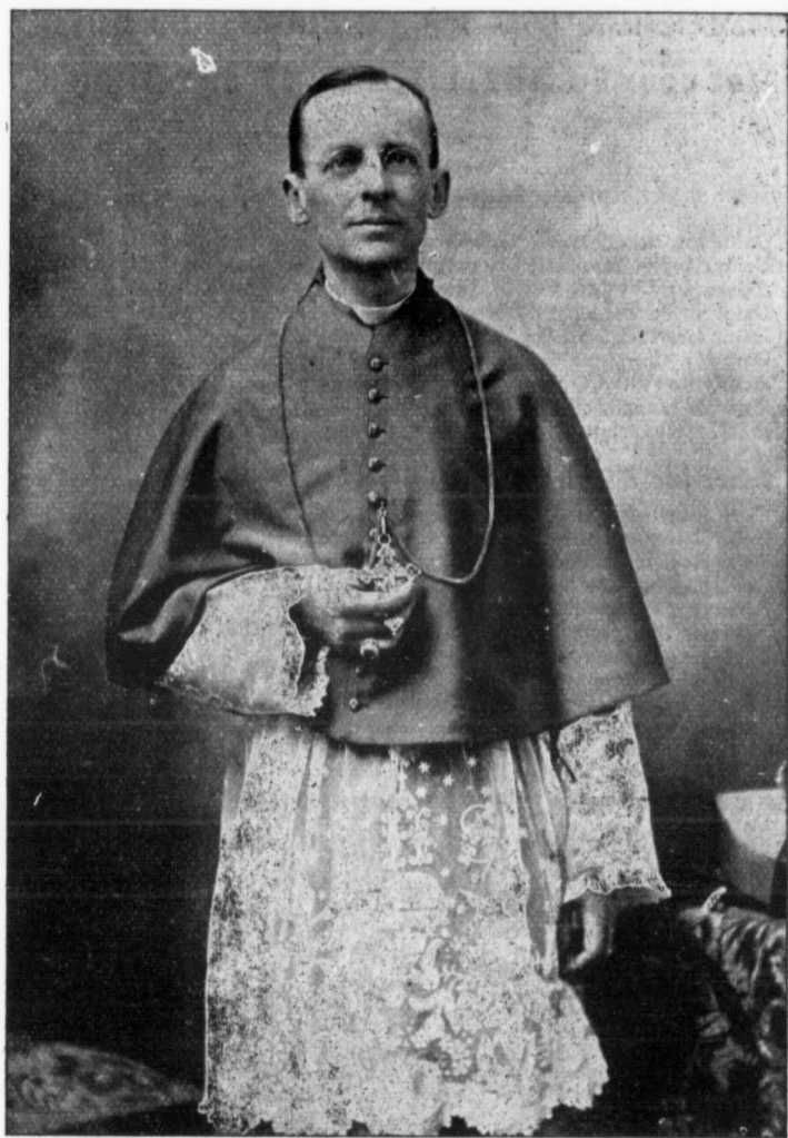
MGR BRUCHESI, ARCHEVÊQUE DE MONTRÉAL