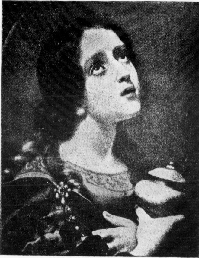
SAINTE MARIE MADELEINE