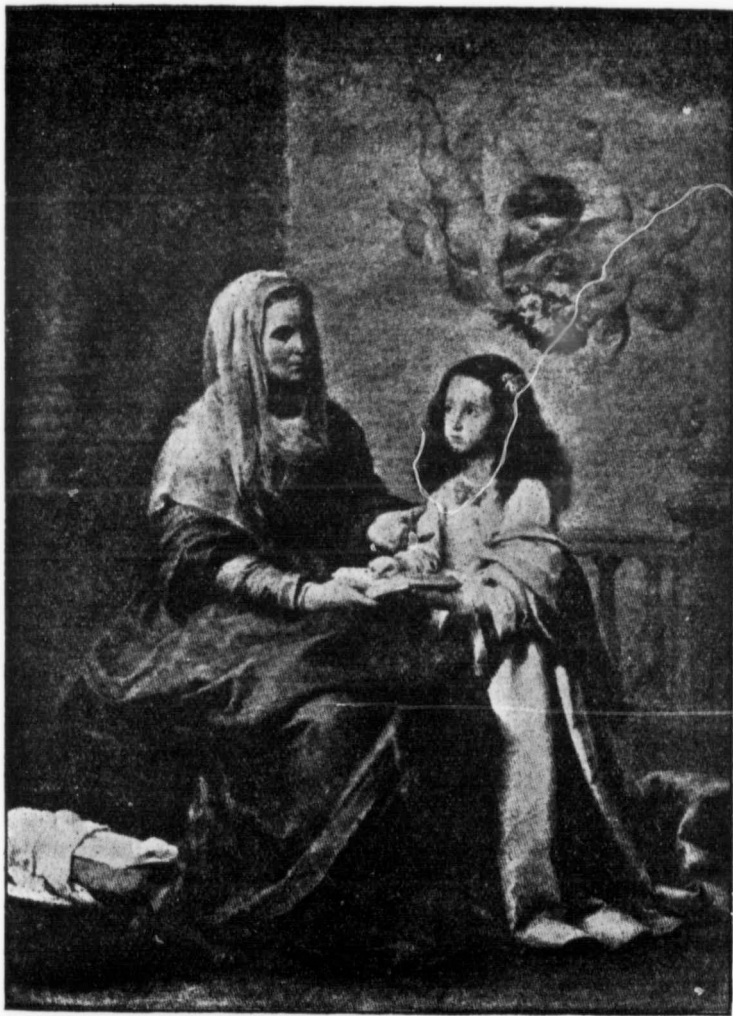
SAINTE-ANNE ET LA SAINTE-VIERGE