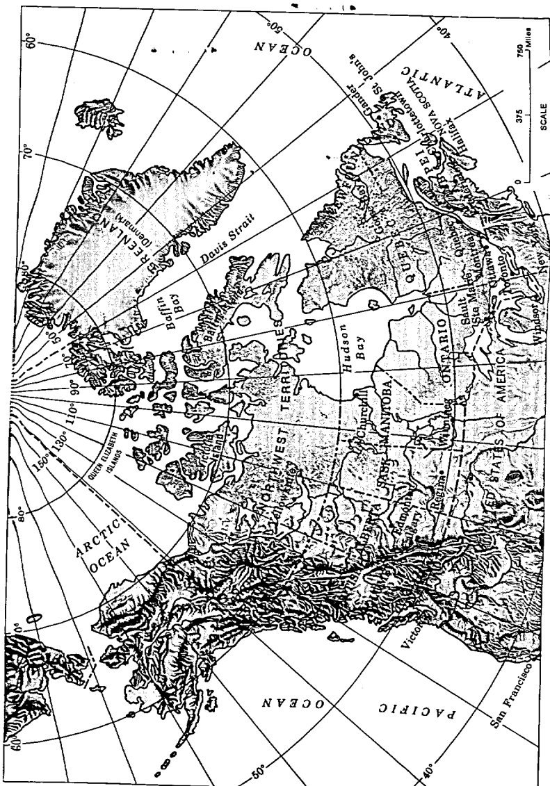
Produced by the Surveys and Mapping Branch, Department of Energy, Mines and Resources, Ottawa, 1973