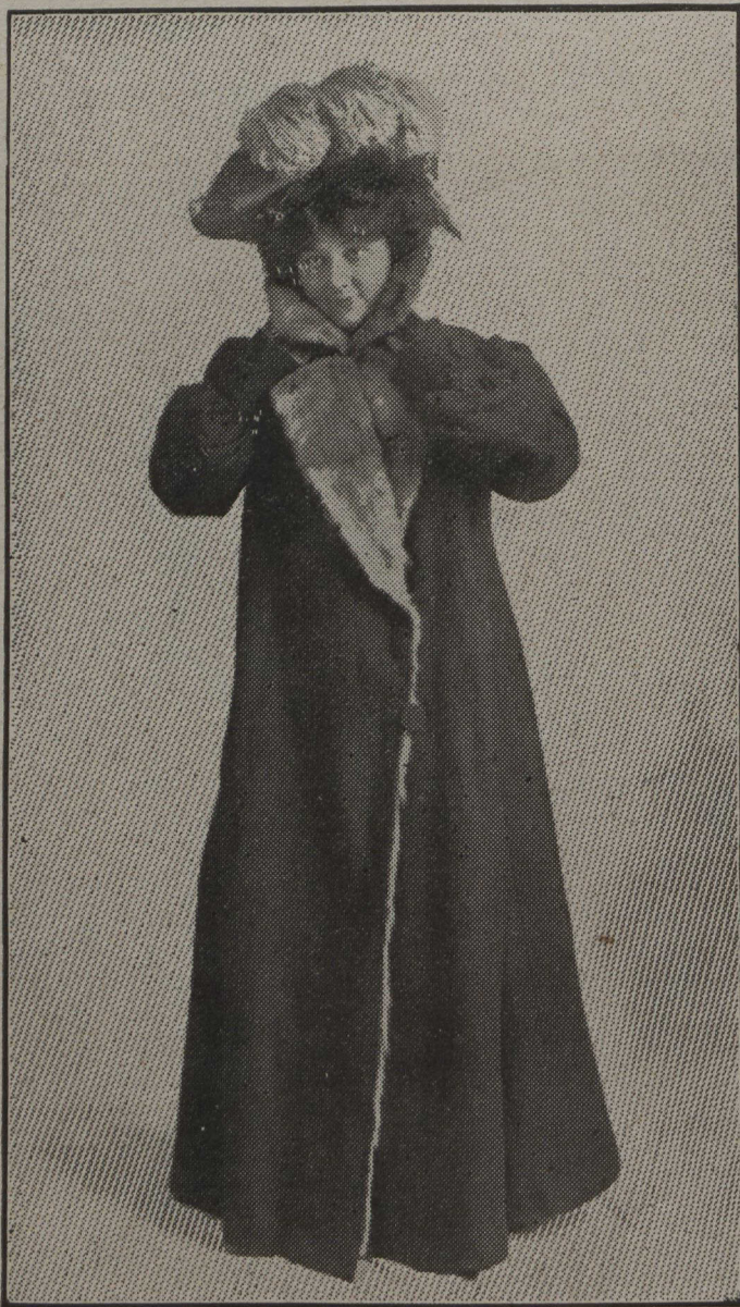
ELEGANTE PELISSE EN DRAP doublée d'écureuil. Col et revers de même fourrure. Chapeau de velours castor orné de plumes d'autruches.

même que la paillette; on fait aussi des sergés à grosses côtes très marquées, des surahs et des reps, mais nous ne saurions trop le répéter, il ne faudrait pas vous figurer que l'on vous montrera, madame, d'épaisses soies se tenant debout, non, tout s'est assoupli pour se prêter au travail de l'aiguille.