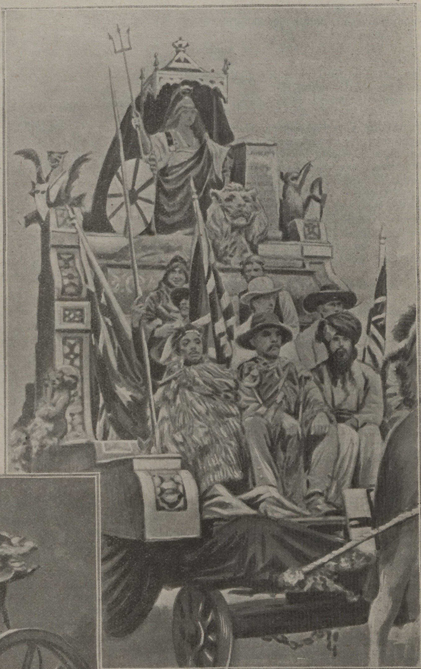
La cavalcade du lord-maire : char de la Grande-Bretagne et de ses colonies.

A midi, le cortège quitte le Guildhall, précédé de musiques militaires. Les pompiers et leurs engins automobiles ouvrent la marche; viennent ensuite les représentants des corporations, bannières en tête, un canot de sauvetage traîné sur un chariot par six chevaux; puis, chargés de figurants aux costumes bariolés, les inévitables chars allégoriques, notamment celui de l'"Empire", où l'imposante "Britannia", déesse casquée, occupe un trône gothique. Le lion britannique est couché à ses pieds; dans sa main droite, elle tient un trident, tandis que sa main gauche s'appuie sur une Bible; elle domine le groupe obligatoire des colonies anglaises.