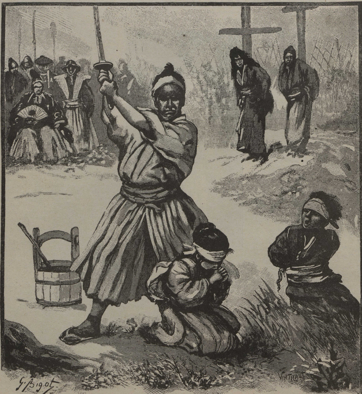
Le bourreau reçoit l'ordre de couper ces têtes innocentes et son bras levé retombe sans frapper

Le voici arrivé à Tokio, où il n'attend plus que