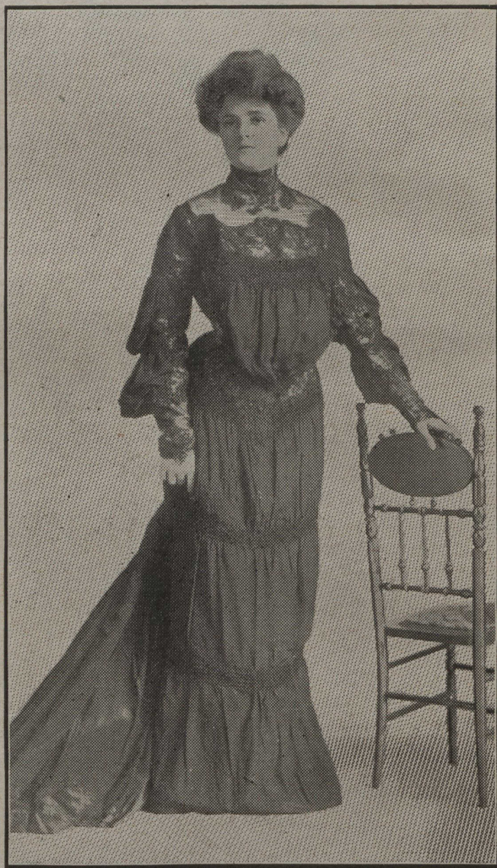
ELEGANTE ROBE DE RECEPTION en peau de soie brun tabac ornée de dentelle et d'appliqués de gaze. La jupe est froncée sur un empiècement de dentelle. Même garniture répétée au corsage et aux manches.

est celui du beige, du rose, du bleu ciel et du mauve, pour ne citer que ceux-là.