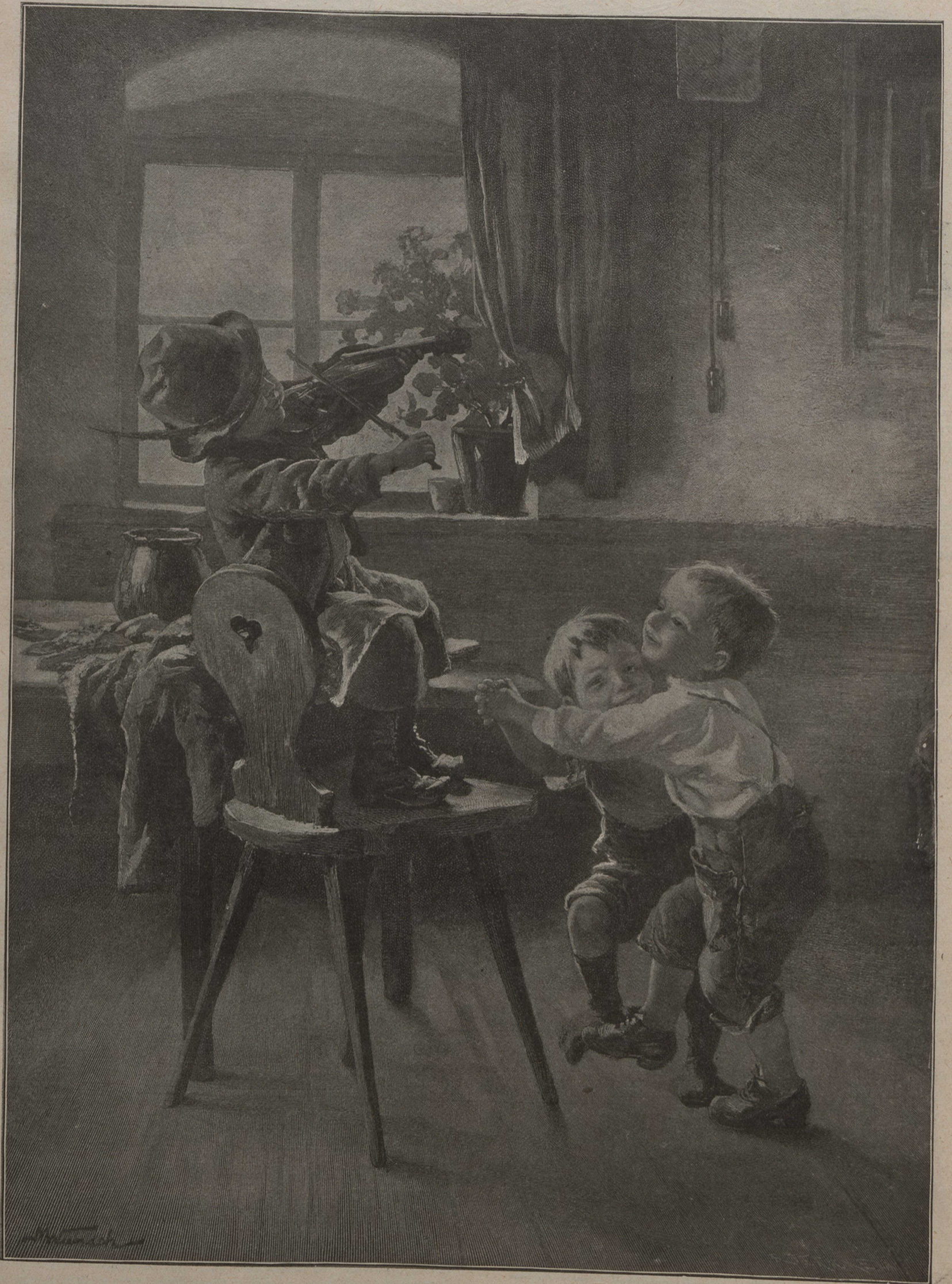
DANSEZ AU SON DE LA MUSIQUE...!