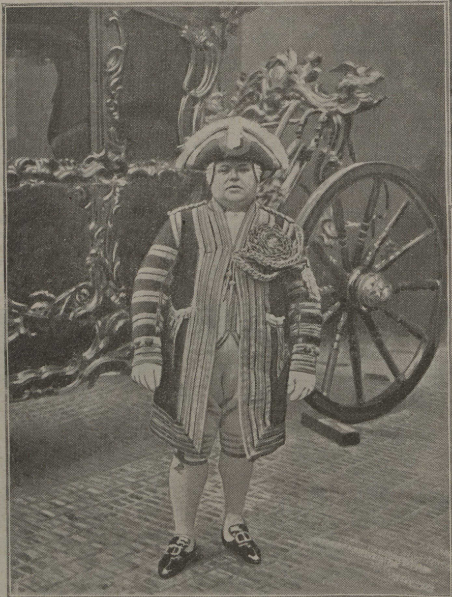
Un personnage de féerie : le cocher du lord-maire en costume de gala.

Voici maintenant les carrosses d'Etat; le premier, entre les musiques des lanciers et les life-guards, est affecté à l'ancien lord-maire; le second, de couleur cramoisie, attelé de six chevaux, s'avance, précédé par des timbaliers, des trompettes, le maréchal de la Cité en grand uniforme historique, des serviteurs en somptueuse livrée. Le nouveau lord-maire en a pris possession, accompagné de son chapelain, du porteur de l'épée et du porteur de la masse d'or; il répond par des saluts aux marques de sympathie de la foule. Et, pour compléter le prestige d'un tel équipage, le cocher, à qui incombe l'honneur de conduire l'éminent magistrat, orne le siège de sa majestueuse ampleur, un superbe cocher dont l'embonpoint décoratif serait à lui seul un "clou" à succès dans une féerie.