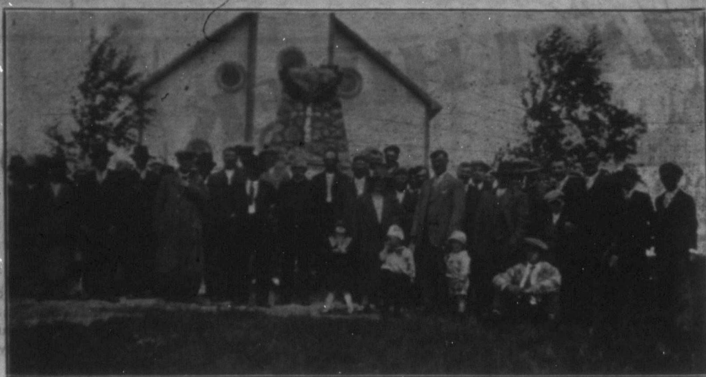
Emlékoszlop szentelési ünnepség Szent László telep 25 éves jubileumán. — Képünk a r. kath templomot az emlékoszloppal, valamint a résztvevők egyik csoportját ábrázolja.