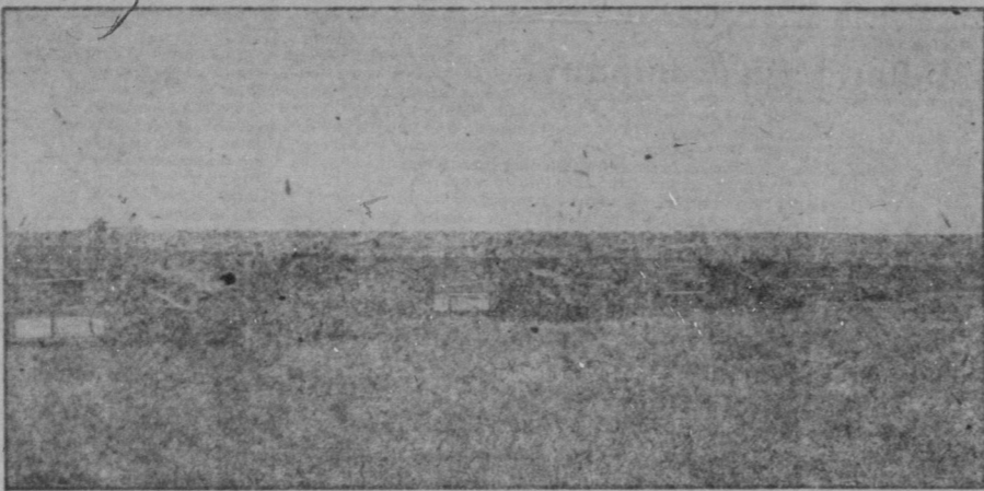
Farm scen i Norra Alberta.

Den i tillväxt stadda staden Wetaskiwin är belägen 152 mil norr om Calgary och 43 mil söder om Edmonton på järnvägen