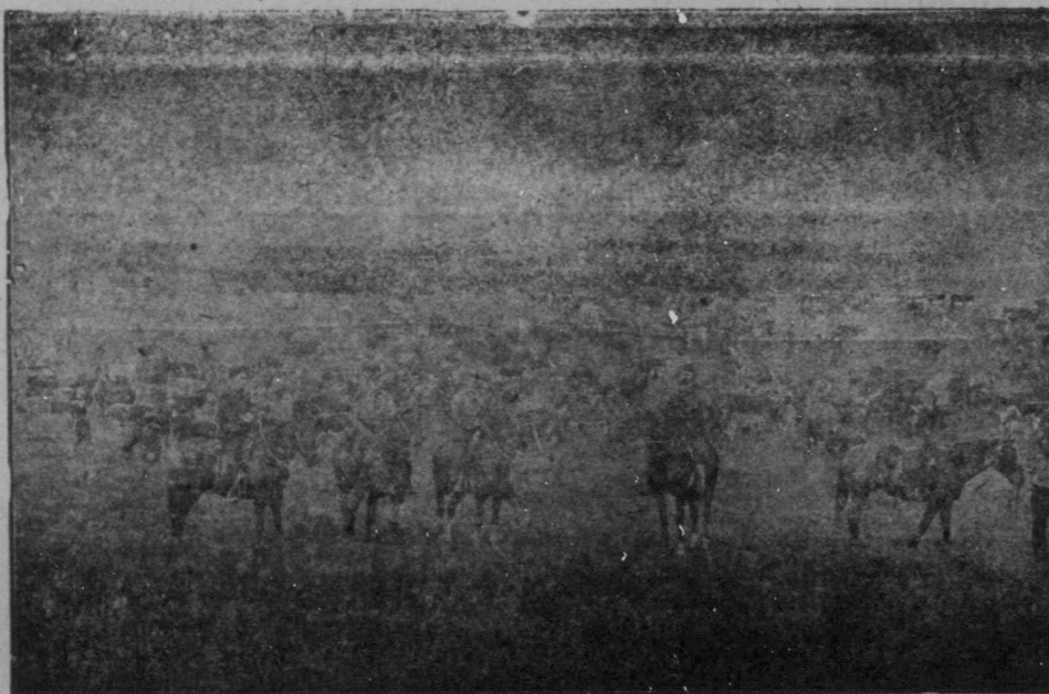
Boskaps farm i Norra Alberta.

Europeer fly från Feg. Oficiell rapport från Morocco säger att sultanen har ånyo låtit arresteras sin broder Mulai Mohammed, samt att rebellerna förorsakat sultanens armee ett nytt nederlag.