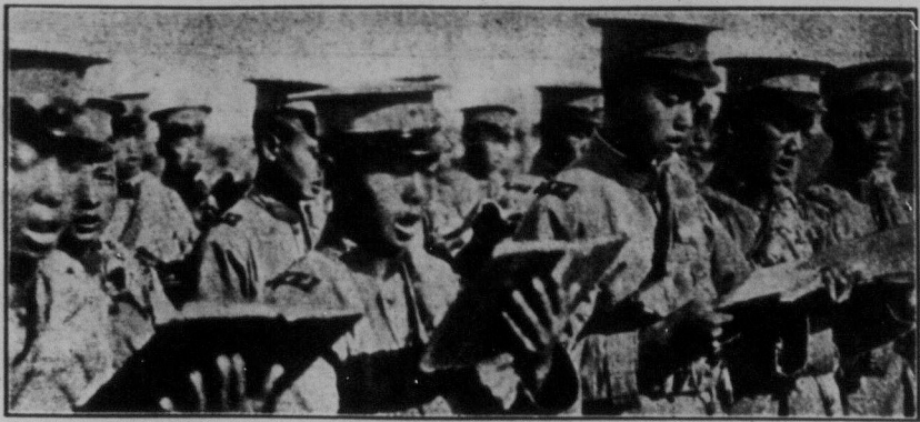
Жовіри революційної китаїської армії, якою командує генерал Фен Ю-Сен, у вільних хвилях співають революційні пісні. Ця армія в останньому часі прогнала армію Чан Цо-Ліна з величезної території двох провінцій, що лежить між ріками Янцє і Жовтою.

"Чан Кай-Ші скінчена людина. Об'єктивне його становище безнадійне. Наймовірніше, що він діє врятування свого становища піде на компроміс з північними мілітаристами та на згоду з імперіалістами. Щоб завоювати співчуття останніх, він придрує робітничий рух і розстрілює робітників. Чинячи так, він може зберегти владу на короткий час, але скінчить він цілковитим банкрутством. Кар'єра Чан Кай-Ші скінчена не тільки як кар'єра революціонера. Навіть як мілітарист він вчинив самогубство. Що далі, більше незадоволення серед населення та в армії швидко потягне за собою його падіння. Лише 2 або 3 дивізії додержують що до його злыбажності. Інші ще й досі не знають правди. Цим пояснюється його система сітї брехливих фальсифікованих повідомлення про те, щоби його підтримують Ван Тін-Вей, Тан Ен-Кай й вдова Сун Ят-Сена.