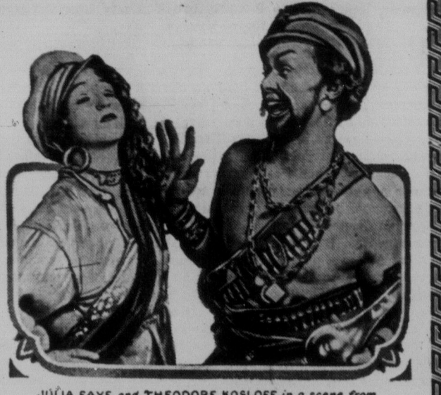
JULIA FAYE and THEODORE KOSLOFF in a scene from CECIL B. DE MILLE'S Production "THE VOLGA BOATMAN"

славна американська фільма відомого постановщика й директора Сесила Б. Де Мила п. н.