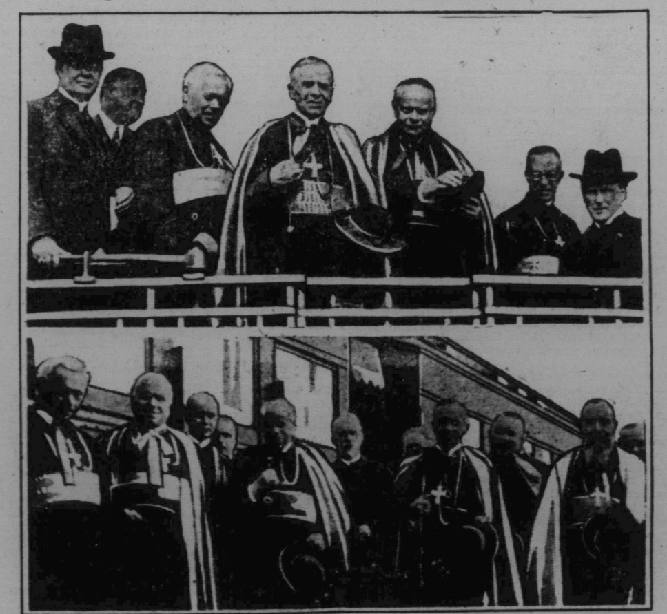
Den största religiösa sammankomst, mäs. Kongressen varade i fem dagar...