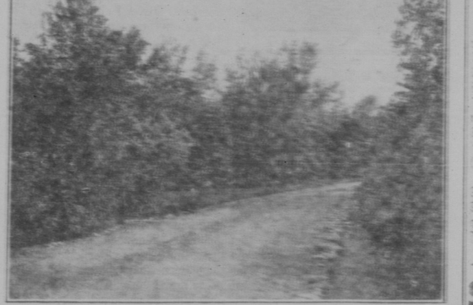
Sährend die kanadische Prairie im allgemeinen einen entzückenden Eindruck macht...