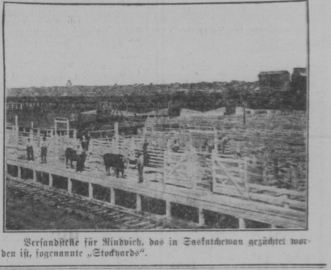
Verandete für Hindvieh, das in Saskatchewan geüdet worden ist, sogenannte „Stockherde“.

Die Tora-Methode, und hat wieder einmal bewiesen, daß Tora-Methoden niemals von den edlen und hohen Gefühlen des menschlichen Herzens und des menschlichen Geistes ausgehen, sondern von der Angst, der Mißgunst und dem Mißtrauen, das die Tora-Partei immer auszeichnet, wo sie die Macht hatte. Wir scheinen, daß der werde Herr selbst fühlen muß, daß die von ihm vertretene Politik schwach und nichtswürdig ist.