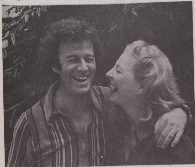
Gordon Pinsent et Charmion King dans un moment de détente.

Ensuite vint le moment où Radio-Canada lui