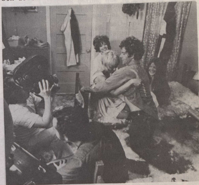
Le directeur de la photographie Ed Long captant une scène turbulente du film.

Quelques mois plus tard, lorsque sortit The Rowdyman , ce fut au tour des critiques de cinéma de l'applaudir. Une fois de plus, Pinsent jouait un rôle qu'il avait créé lui-même, et qui était à la hauteur de son double talent d'acteur et d'auteur. Le rowdyman