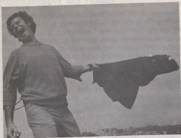
"Crie - le sur tous les toits" ...cri désinvolte du "Rowdyman".

Gordon Pinsent, acteur, chanteur, dramaturge, scénariste, auteur d'une comédie musicale enfantine et de chansons, est aussi un peintre qui aime manier le crayon. Mais c'est par l'expression même de son être tout entier qu'il préfère créer, par son visage, sa voix, son corps. Gordon Pinsent est acteur dans l'âme.