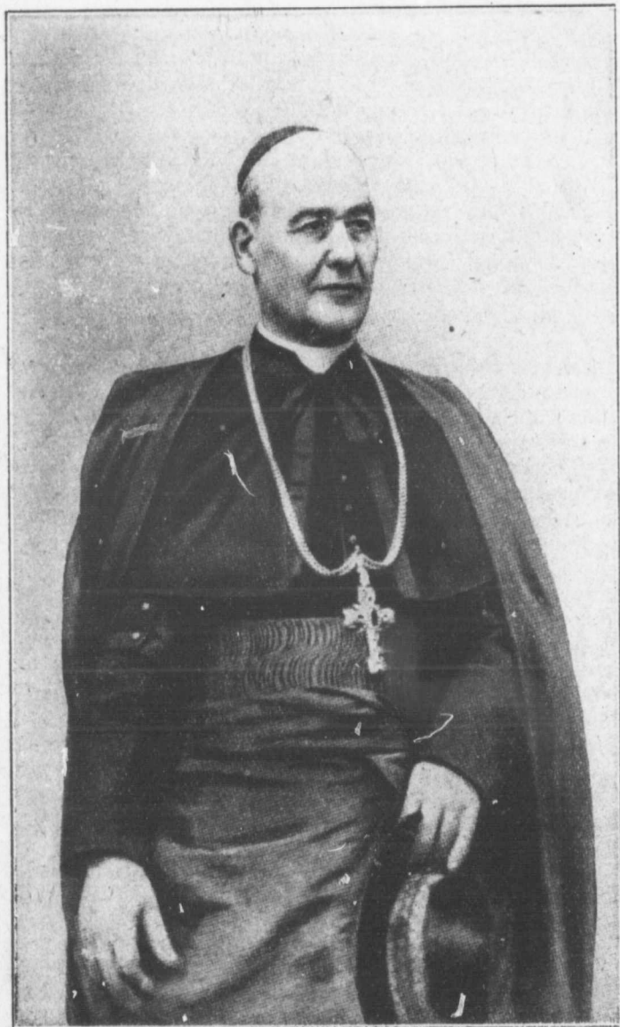
S. E. le Cardinal VINCENT VANNUTELLI, Légat du St-Siège.