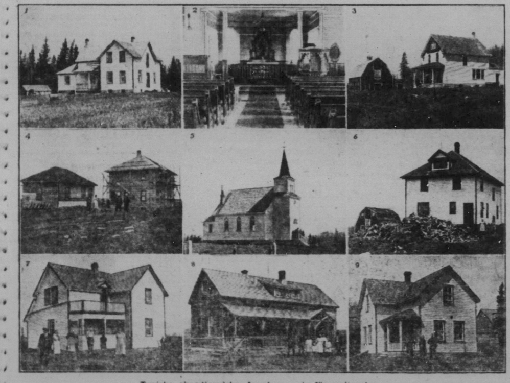
Typiska skandinaviska farmhem och församlingshus.