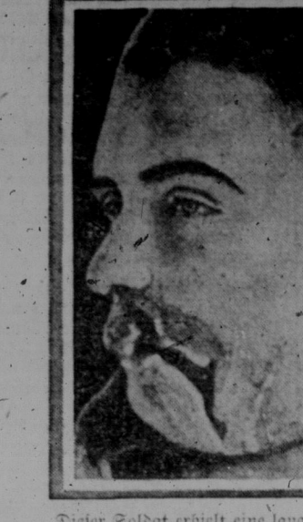
Dieser Soldat erhielt eine lange flache Wunde auf der linken Wange, wie auf dem Bild zu sehen ist. Das Gesicht, das die Wunde verurteilte, durchdrang den Mund und geriet in seinen Lärm den Rest der Wunde, der sich in einem Falle in einer sehr großen Anzahl von Fällen ergibt worden. Die vorzüglichen Leistungen dieses Mannes zeigen sehr klar die großen Fortschritte der plastischen Chirurgie gemacht hat. Das Ende des letzten Jahres wurde durch ein tragisches Schicksal der Tod für sein Vaterland zu erleiden.

Die deutsche Ration wird langsam erwärmt, sagt Dr. Lorenz. New York, 4. Dez. — Dr. Adolf Lorenz, der berühmte österreichische Chirurg, sagte in einer in der Columbia Universität gehaltenen Ansprache, daß die Vereinigten Staaten und England sich verbinden sollten, um zu verhindern, daß die deutsche Ration langsam erwärmt werde.