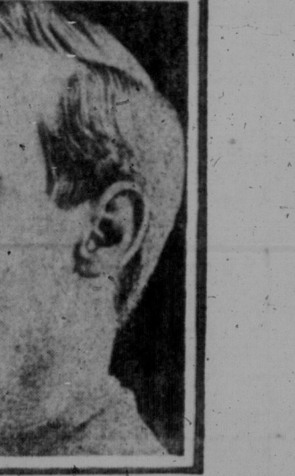
Soldat G erhielt 1916 eine schwere Verwundung durch Granat splitter. Außerdem wurde ihm der untere Kieferknochen gebrochen. Ein kleines Stück Fleisch vom Gesicht wurde eingepflanzt. Das Bild zeigt, daß ihm außerdem ein Ohr verloren fortgeschaffen war.