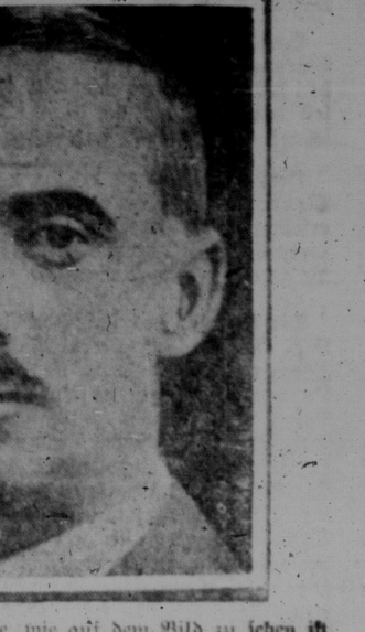
Soldat G erhielt 1916 eine schwere Verwundung durch Granat splitter. Außerdem wurde ihm der untere Kieferknochen gebrochen. Ein kleines Stück Fleisch vom Gesicht wurde eingepflanzt. Das Bild zeigt, daß ihm außerdem ein Ohr verloren fortgeschaffen war.

Belgien muß drei Jahrsange seiner Truppen unter die Fahnen. Brüssel, 4. Dez. — Vorbereitungen sollen begonnen werden, um die Klassen von 1919, 1920 und 1921 unter die Fahnen zu rufen und eine dieser Klassen soll sofort einberufen werden. Sozialistische Mitglieder der Deputiertenkammer veröffentlichten Berichte, worin sie sagen, daß die deutschen Propagandisten unermüdlich mühen und daß die letzten Ereignisse in Deutschland bewiesen hätten, daß es mit der Demokratie zu Ende gehe.