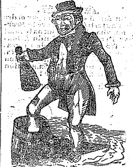
En revenant du ministère, Un soir que j'étais rond, etc.