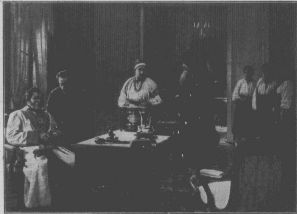
Пан Енгельгардт, в якого Тарас Шевченко був кріпаком, продає сільських дівчат-кріпачок. Біля пана (ліворуч) вихилився панський економ, а одну дівчину оглядає покупець. Інші дівчата чекають своєї черги.

Фільма ця буде показуватися в слід. місцевостях і днях: Порт Артур, 14 — 15 березня. Вест Форт Вільям, 19 — 20 березня. Форт Вільям, 16 — 17 березня. Форт Френсес, 22 — 23 березня.