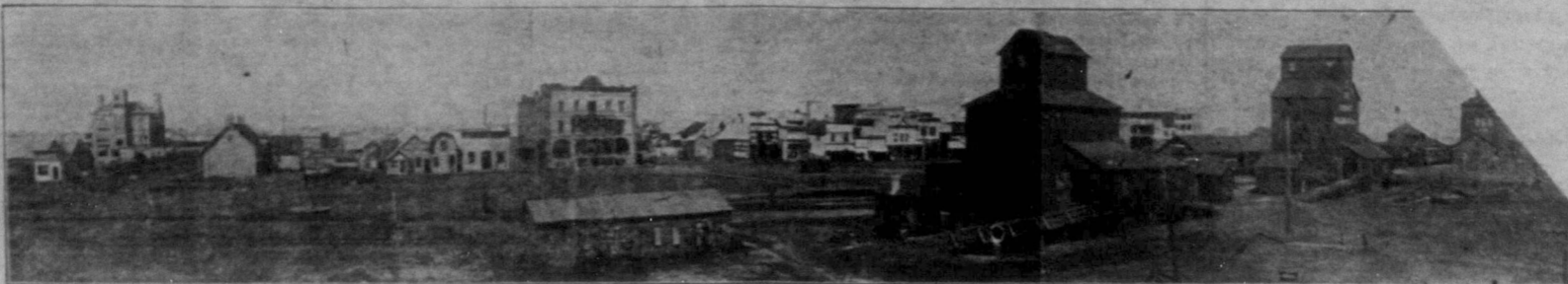
Albertas kornbod, det största sädproducerande distrikt i Alberta.