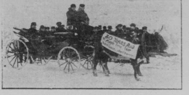
Denna något ovanliga syn tedde sig för sjuttio år sedan. Det var en öppen drovsko som drogs af ett par lastanta oxar. I drovskan befint sig ett halvt dusen af stadens borgare, som på detta sätt ville exemplifiera stadens utveckling under de senaste årtiondena.