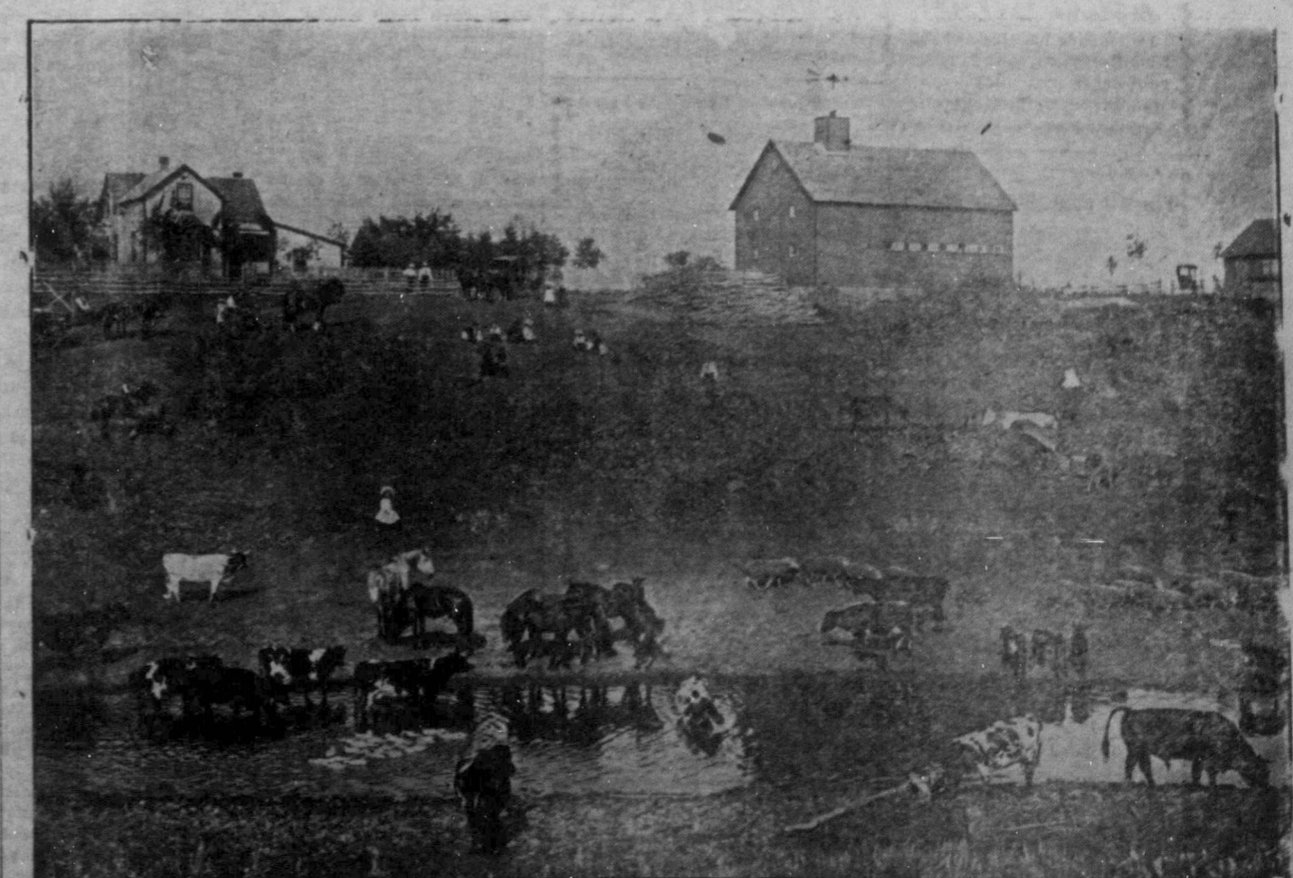
En farmscen i soliga Alberta.