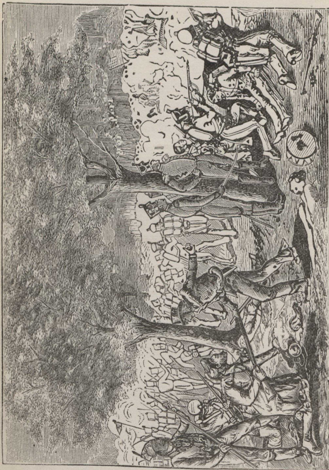
BATAILLE DE CHATEAUGUAY.