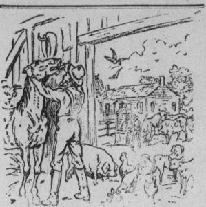
L'AMI DES PAUVRES.

MM. D. Chisholm et Cie, ont réédité leurs chapeaux, nuages, manteaux, châles, pardessus, au prix coûtant, et toutes les autres marchandises en magasin réduites de dix pour cent, dans le but de vendre autant que possible de leurs marchandises d'hiver avant que les nouveaux effets du printemps arrivent. Rappelez-vous de l'adresse: Magasin de modes de Lorne, 39 rue Sparks, la première maison du genre en gros et en détail à Ottawa.