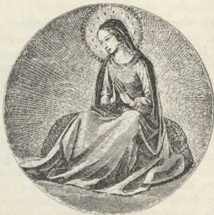
VIERGE DE LA GLOIRE

Le dimanche 9 août, à l'occasion du pèlerinage de Saint-Hyacinthe, aura lieu au Cap une grande manifestation dominicaine, à laquelle les pères dominicains se font un plaisir d'inviter les amis de la reine du Rosaire et de leur ordre.