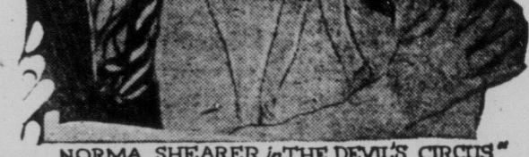
NORMA SHEARER in “THE DEVIL'S CIRCUS”

В цій фільмі побачите ший цирк після європейського стилю. Головну ролу в штуді має славна кіно-фільмова акторка НОРМА ШІРЕР. Крім неї виступають Чарлс Еммет Мек, Кармел Меєрс та інші. Фільма переповнена цирковими небезпеками і пригодами і варто її побачити. Приходіть як найчисленніше.