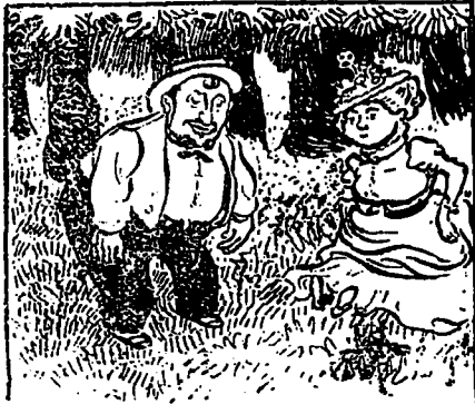
—Ah ! nous sommes très bien ici pour nous reposer... asseyons-nous.