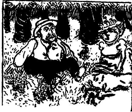
—Aie, je viens de m'asseoir sur quelque chose de piquant !...