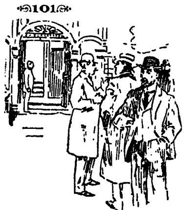
UN VRAI PALAIS

Ce que vous voyez là n'est que l'ex- térieur. C'est surtout à l'intérieur que le P'tit Windsor est beau et qu'il y a du monde chic. Au 101 rue St-Laurent. Repas complet à 25 cts, avec toutes les primeurs de la saison.