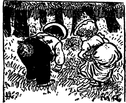
—Tu es fou... tu vois bien qu'il n'y a rien ! absolument rien ! —C'est un peu fort ! je t'assure cependant que ça m'a piqué !