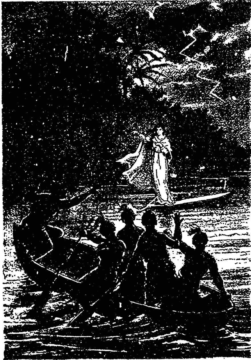
Je la vois ! Je la vois ! poursuivait Rattlesnake.

La frêle barque se mit à voler sous les efforts du vigoureux rameur : Marguerite aurait été précipitée au milieu des flots que son désespoir n'aurait pas été plus affreux : elle se voyait déjà victime et prisonnière dans la sombre hutte du sauvage.