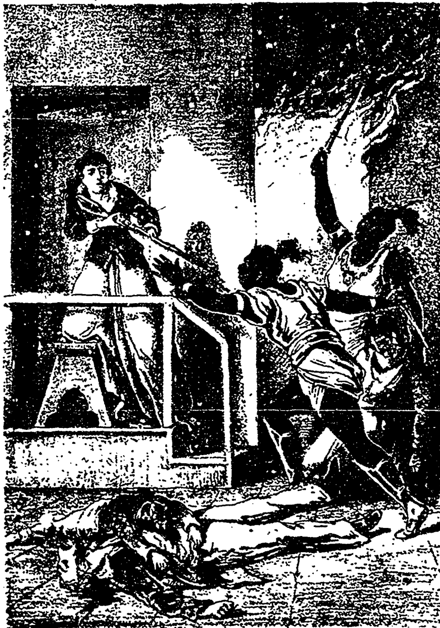
Elle écarta ses longs cheveux humides et coucha son ennemi en joue.

En proie à des rêves cruels, elle entendit sonner lentement, l'une après l'autre, toutes les heures de la nuit ; lorsque le soleil, comme un chasseur matinal, lança contre les vitres ses