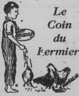
LA QUALITE DES PRODUITS AGRICOLES S'AMELIORE