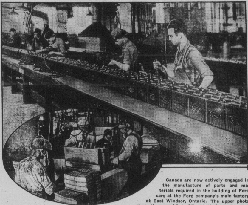
SCORES of Canadian workmen are employed in Toronto plants where batteries for the Ford V-8 and 4-cylinder cars are manufactured. This is just one phase of the active help to industry in Canada resulting from the volume production schedule of the Ford Motor Company of Canada, Limited. Numerous other manufacturing plants in many parts of

Canada are now actively engaged in the manufacture of parts and materials required in the building of Ford cars at the Ford company's main factory at East Windsor, Ontario. The upper photo shows the assembling of Ford batteries at the plant of the Willard Storage Battery Company, Limited. Workmen are sealing, burning on the top connectors and applying the identifying marks to the batteries. Below, workers at the Great-O-Lite Storage Battery Company, Limited, factory are operating a large machine which fills the lead grids, or metal backbones of the batteries, with a paste of active materials.