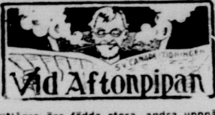
Några äro födda stora, andra uppnå storhet och återigen andra få den kastad på sig.

Allt amerikanskt är stort. Det är till och med det största i världen. Det är något som bekant.