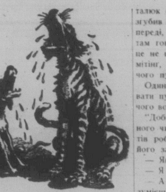
ЛЕКЦІЯ петлюривських брехунів про радянську п'ятилітку.