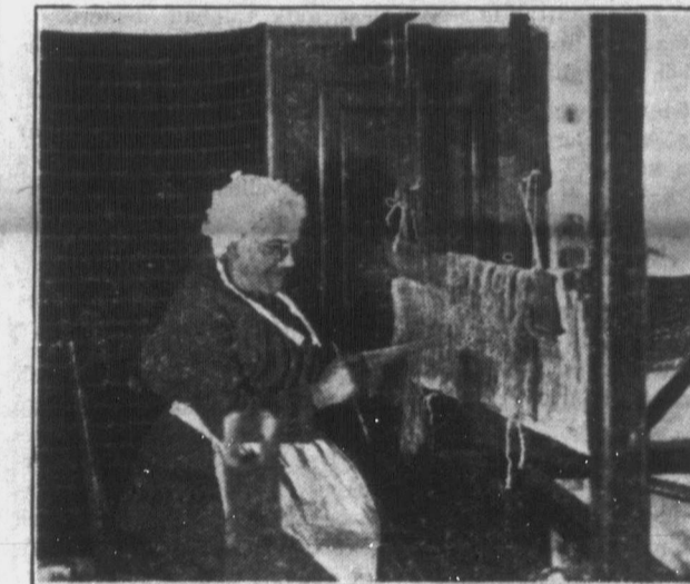
Fenti képünkön egy szövögető anyókat mutatunk be abból az alkalmából, hogy az ősz folyamán ismét nagyszabású kézimunkakiállítás rendez Montrealban a Canadian Handicrafts Guild, mint annak titkáratól értesülünk. Október 15.-én nyílik meg a két hétig tartó kiállítás, melynek keretében a Kanadában megtelepedett nemzetiségek szebbnél szebb népies művészetét fogják bemutatni. A kiállításra szánt tárgyaknak október elseje és 10-ike között kell megérkezniük a Handicraft Guild címére (1240 St. Catherine St. West, Montreal, Que.). Remélhetőleg Kelet- és Nyugatkanada magyarsága az idén még fokozottabban ki- veszi részét ebből a nemes versenyből.

Elmondja többek közt, hogy mit vesztett Magyarország a trianoni békében és hangzatosabban, hogy a csehek, románok és szerbek jól tudják, hogy amit a trianoni békediktátum ajánlókedző kedvű szerzőtől ajánlékba kaptak, azt nem tarthatják meg örökké, még akkor sem, ha százszor olyan állig fegyverben öröködnék a határok mentén.