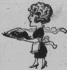
CA SENT BON

Partie de hockey de hier après-midi: St-Léonard 0, Edmundston 7.