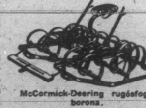
McCormick-Deering rugós fűgő borona.

A McCormick-Deering gyár által előállított talajművelő gépek minden gazdasági munkát jól végeznek s a következők egyikekben kaphatók: tárcsaboronák; talajporhanyítók; szántóföldi, ká pántos, gyümölcsösökért-kultivátorok, rugós fűgő boronák; tárcsaboronák; szegőboronák és kőrforgó kapások.