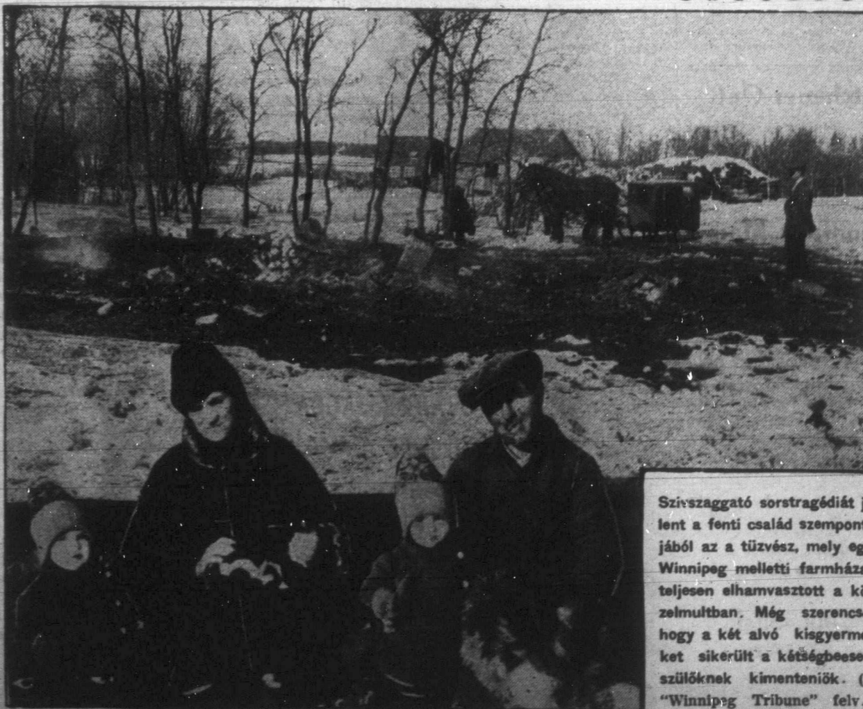
Szívszaggató sorstragédiát jelent a fenti család szempontjából az a tüzvész, mely egy Winnipeg melletti farmházat teljesen elhamvasztott a közelmúltban. Még szerencse, hogy a két alvó kisgyermeket sikerült a katasztrófában szülőknél kimenteniök.

Az ország legnagyobb gabonatermelő tartományá, a mult esztendő rossz termésé miatt pénzügyi zavarokkal küzdő Saskatchewan négymillió dolláros kölcsönre dobott piacra kötvényeket hat és fél százalékos kamattal. A montreali és torontói bankvilágban hihetetlen érdeklődés nyilatkozott meg a tartomány kölcsöne ügyében s bár akadtak olyanok, akik sőtétent láttak Nyugatkanada anyagi helyzetét, mindenképp több bizalmat árult el Keletkanada részéről az a tény, hogy a kölcsön kibocsátásának első napján máris tuljegyzték a kért négymillió dollárt.