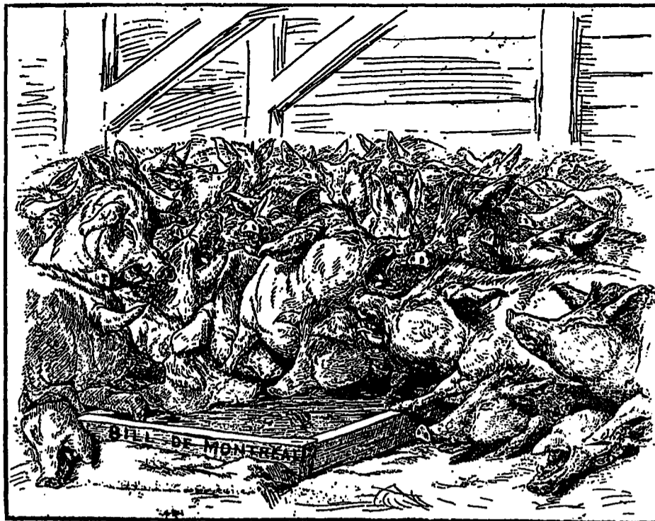
LA COCHONNERIE A QUÉBEC

Un jury américain vient de rendre le verdict suivant: "D'après les apparences du cadavre nous sommes portés à croire que le défunct a été écrasé par un train de ballast, mais d'après des objets et un agenda trouvés sur sa personne, nous avons découvert qu'il a pris une part active dans un match de foot-ball".