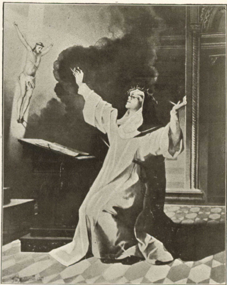
STE CATHERINE RECEVANT LES STIGMATES