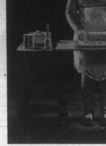
A magyar lányok már kicsiny korukban megtanulják szeretted és anyjuktól a sütés-főzés tudományát s így fognak megéltédek mivla is dicsőségbe szerezni a magyar névnek s megbecsülést — önmaguknak!

semmi jóra. Az emberből sem teremti ki legjobb tulajdonságait. A fegyelmezett és teljes önuralommal rendelkező ember a sége.