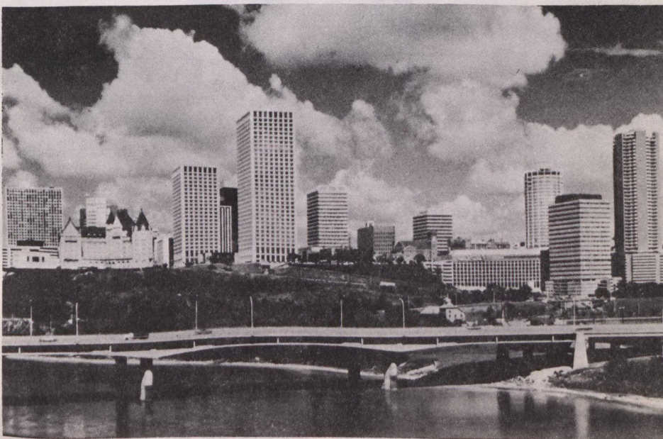
Edmonton, capital de la provincia de Alberta, tiene una población de 555.000 habitantes. Su área metropolitana cubre 321 km 2 .

Edmonton fue colonizada primero en 1795 como un puesto de trueque sobre el río North Saskatchewan, la principal carretera del comercio de pieles. En 1896 se convirtió en el punto de partida de la ruta terrestre a los campos de oro Klondike del Yukón.