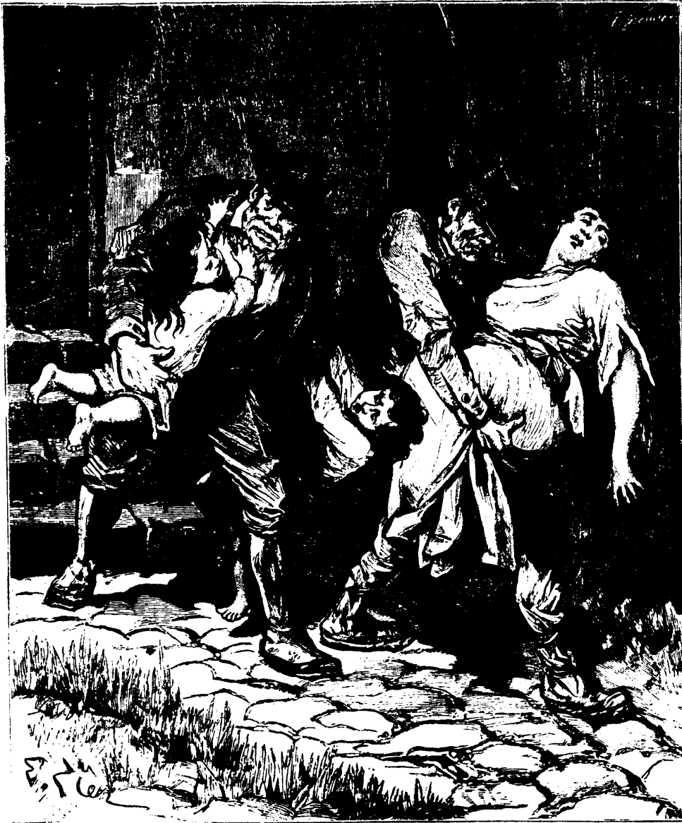
Nous l'emportâmes avec les enfants.—(Voir page 30 col 1.)

—J'ai ajouté que, pour savoir jusqu'à quel point cet amour était partagé par le peintre, nous devions avoir auprès de lui un confident qui fût à la fois le sien et le nôtre. J'ai nommé mon fils Juan Antonio, et son dévouement vous a prouvé que je ne pouvais faire un choix meilleur. Juan est aujourd'hui l'intime d'Horace Stone. Par lui je sais et nous savons chaque jour ce que dit et pense l'artiste, et nous saurons bientôt ce que dit et pense sir Richard.