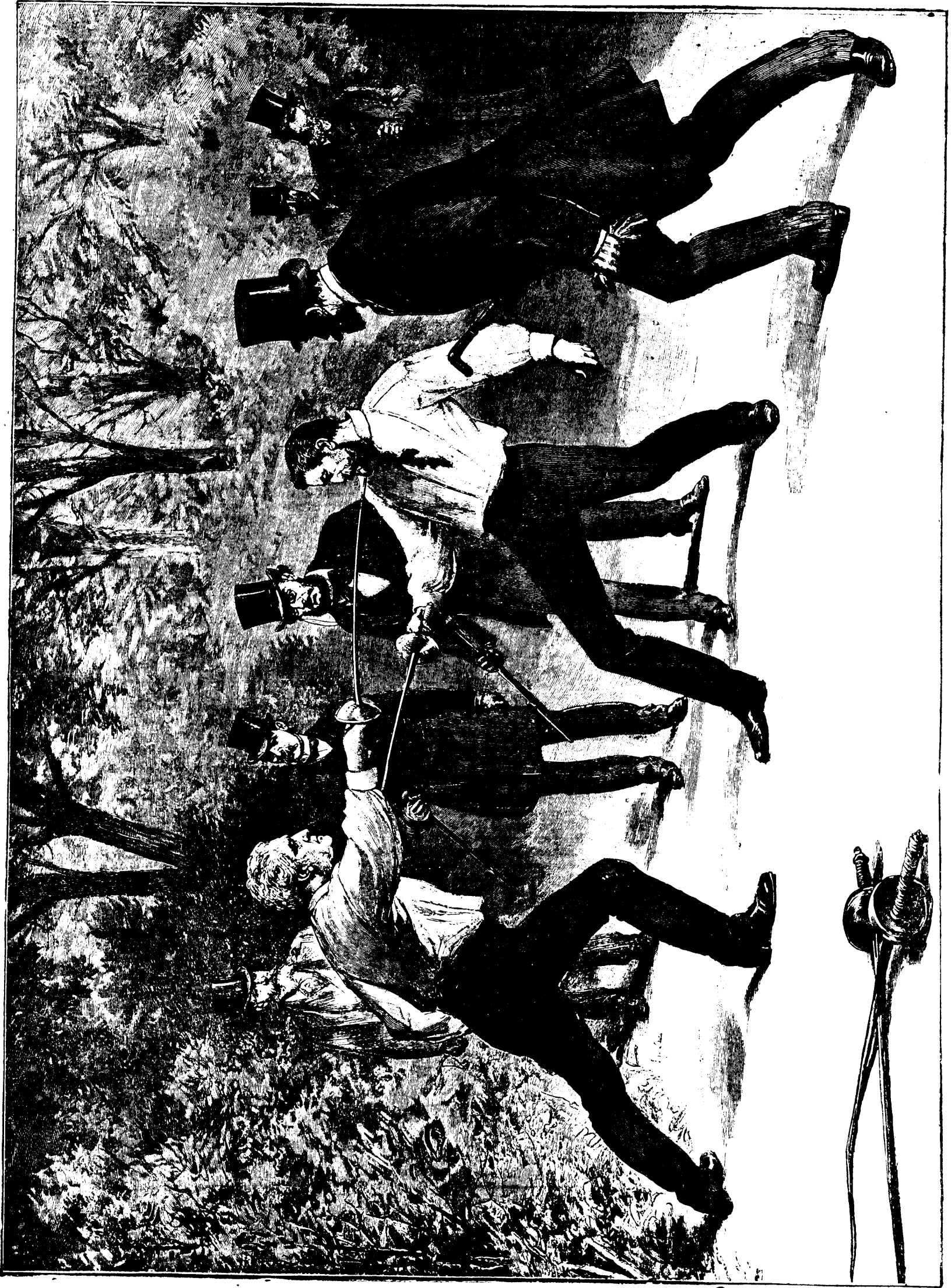
M. Le Herisse. Les médecins.